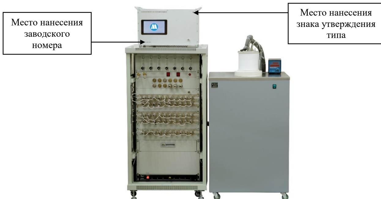
Рисунок 3 - Внешний вид генератора влажного газа эталонного Суховой-3, Суховой-3П в настольном исполнении (с модулем управления и индикации в комплекте с термостатом и стойкой с измерительными камерами для установки преобразователей гигрометров) с указанием мест нанесения знака утверждения типа и заводского номера.

Генератор Суховой-4 состоит из основного блока и блока смешения, выполненных в 19-дюймовых корпусах. В Генераторе Суховой-4В блок смешения встроен в основной блок. Генераторы могут поставляться либо в настольном исполнении с возможностью установки блоков друг на друге (для генератора Суховой-4, рисунок 4), либо в исполнении для установки в стандартную 19-дюймовую стойку, в которой также могут размещаться одна или несколько измерительных камер для исследуемых преобразователей гигрометров, блок газоподготовки и другие устройства. Знак утверждения типа средства измерений и заводской номер генератора наносятся методом фотопечати, прямой печати или лазерной гравировки на панели блоков генератора в места, указанные на рисунке 4: знак утверждения типа – в правый верхний угол передней панели основного блока; заводской номер – в левый нижний угол передней панели основного блока и блока смешения (при наличии).