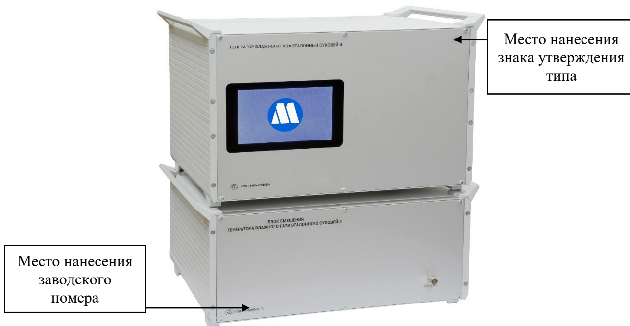
Рисунок 4 - Внешний вид генератора влажного газа эталонного Суховой-4 в настольном исполнении с модулем управления и индикации с указанием мест нанесения знака утверждения типа и заводского номера.

Все генераторы Суховой могут управляться от персонального компьютера, используя соответствующее программное обеспечение (см. таблицу 1). Генераторы Суховой-3, Суховой-3П, Суховой-4 и Суховой-4В могут дополнительно оснащаться модулем управления и индикации, встроенным в блок основного генератора. В этом случае, управление ими может осуществляться либо от персонального компьютера, либо с помощью этого модуля.