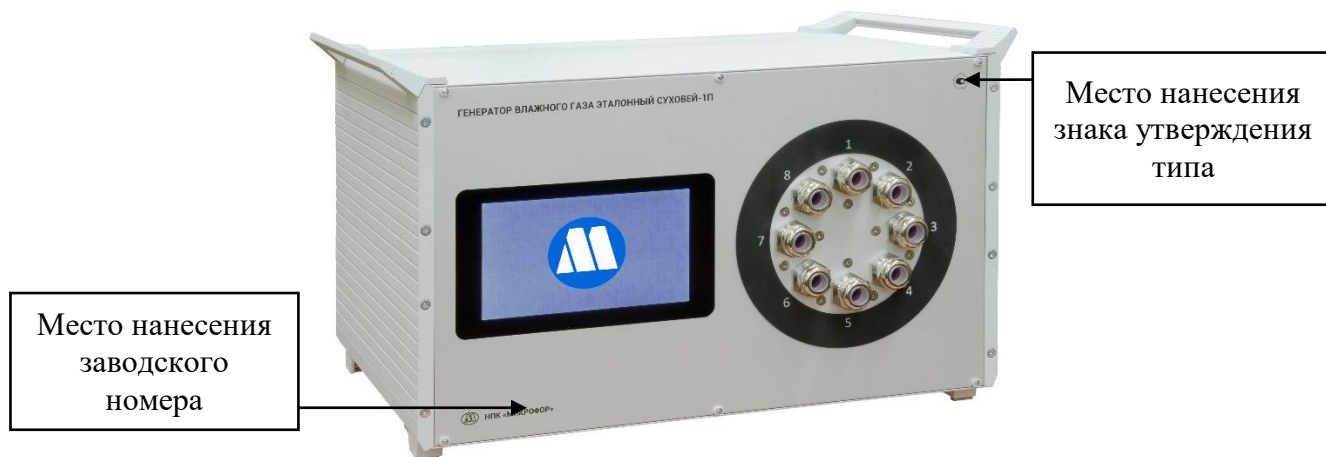
Рисунок 1 - Внешний вид генераторов влажного газа эталонных Суховой-1 и Суховой-1П с указанием мест нанесения знака утверждения типа и заводского номера.

Знак утверждения типа средства измерений и заводской номер генератора наносятся методом фотопечати, прямой печати или лазерной гравировки на переднюю панель генератора в места, указанные на рисунке 1.