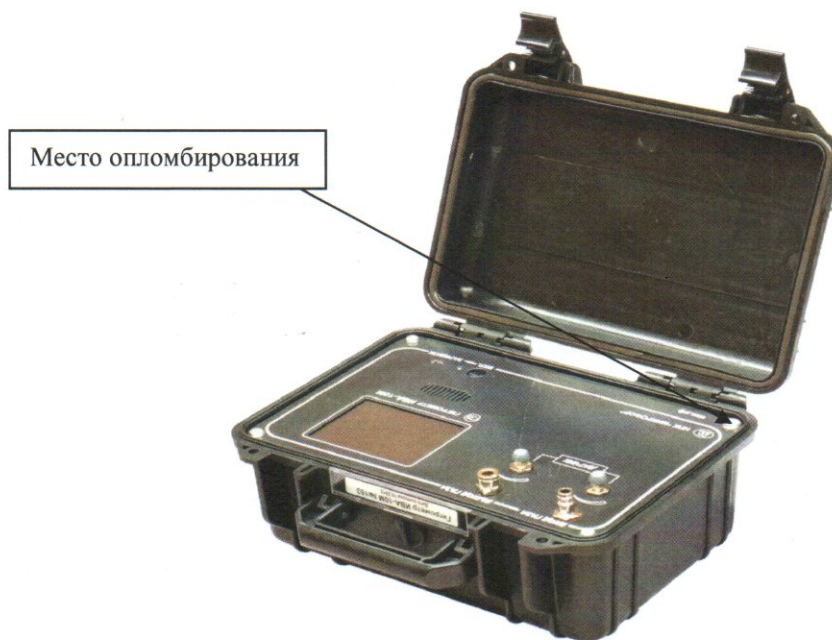
Рисунок 1 - Общий вид гигрометра ИВА-10М

Общий вид гигрометра и схема пломбировки от несанкционированного доступа представлены на рисунке 1.