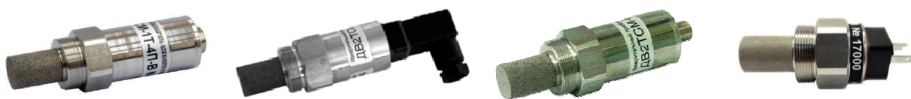
Рисунок 9 - Общий вид измерительных преобразователей ДВ2ТСМ в модификации В