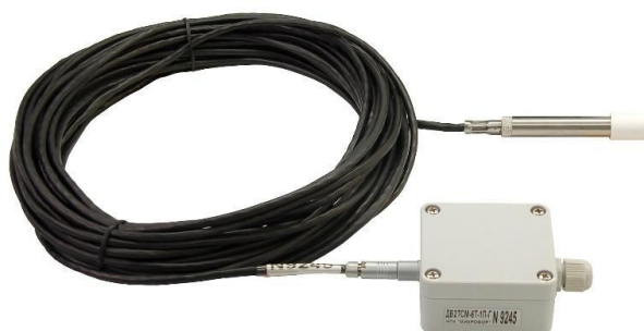
Рисунок 8 - Общий вид измерительного преобразователя ДВ2ТСМ в модификации Г