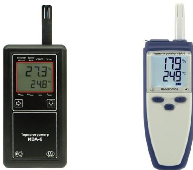
Рисунок 1 - Общий вид термогигрометров ИВА-6Н

Общий вид измерительных преобразователей различных модификаций представлен на рисунках 7-11.