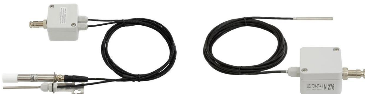
Рисунок 11 - Общий вид измерительных преобразователей ДВ2ТСМ-5Т-5П-АК (слева) и ДВ2ТСМ-5Т-АК (справа, модификация без канала измерений относительной влажности)