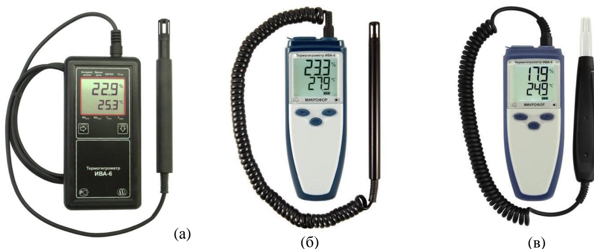
Рисунок 2 - Общий вид термогигрометров ИВА-6А (а, б, в) и ИВА-6Н с удлинителем кабелем КУ-1 (а, в)